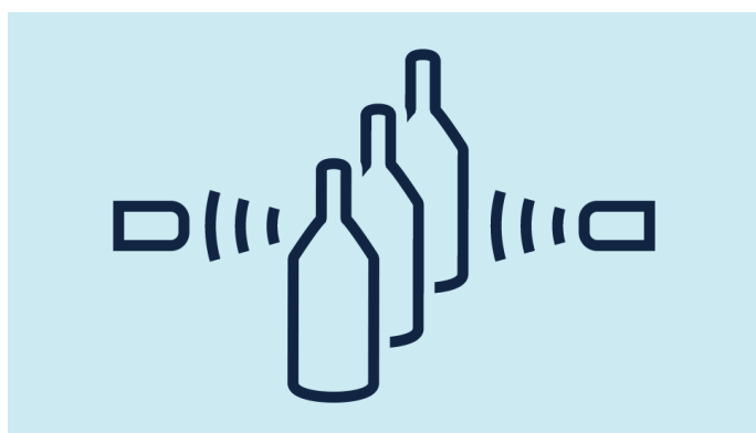
The functional principle ultrasonic through-beam barrier

consists of two constructively-identical units which are operated as a transmitter and a receiver. The two units recognize whether they are intended to work as a transmitter or a receiver via the control input. If pin 2 +UB is activated, this unit functions as a transmitter.